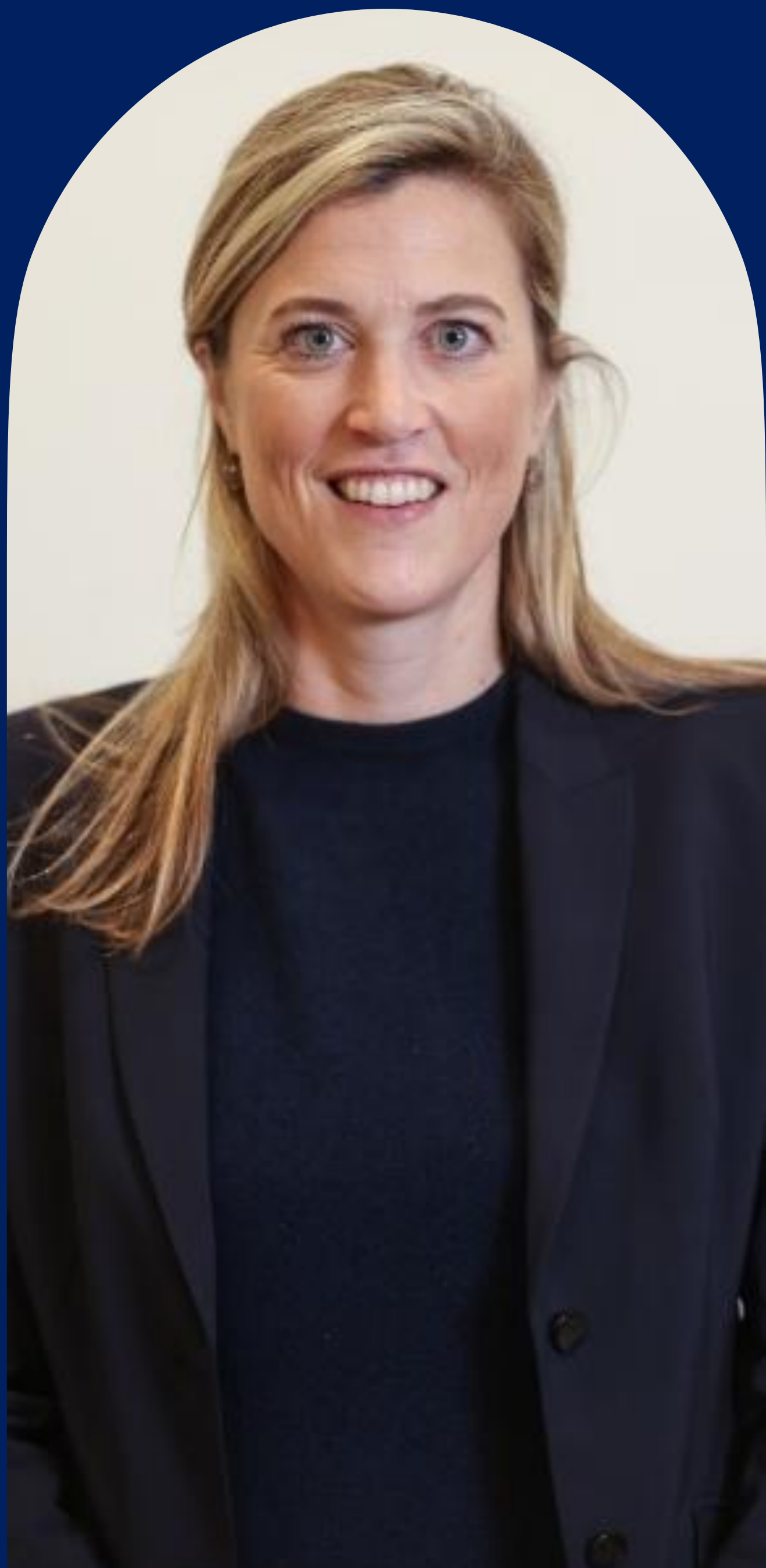
Annelies Verlinden Ministre de la Justice