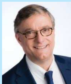
Vincent DE WOLF Burgemeester Etterbeek

In 2020, heeft het 21 gewone zittingen en 19 tuchtzittingen gehouden.