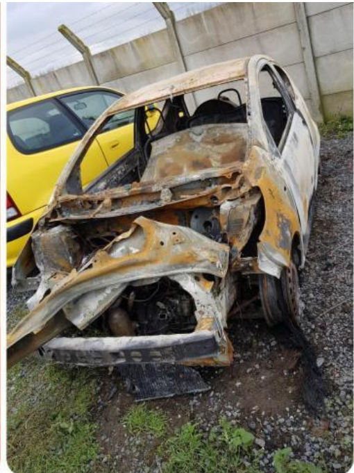
La voiture de Maria a été brûlée.