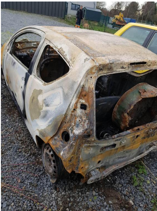
La Citroën n'était pas assurée contre le vol.

La police des Hauts-pays a constaté qu'un vol avait été perpétré à proximité du lieu de l'incendie. Ce lundi, elle a annoncé que l'enquête avait permis l'interpellation d'un auteur mineur, qui a été présenté devant un juge de la jeunesse. Celui-ci a décidé d'un placement en centre fermé.