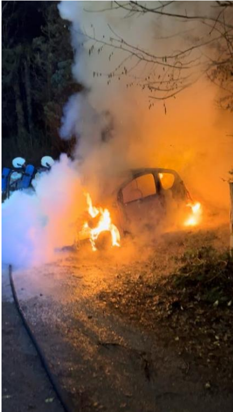
La voiture a brûlé le mardi 17 janvier. - Infos Centre de Secours de Dour

La police des Hauts-pays a constaté qu'un vol avait été perpétré à proximité du lieu de l'incendie. Ce lundi, elle a annoncé que l'enquête avait permis l'interpellation d'un auteur mineur, qui a été présenté devant un juge de la jeunesse. Celui-ci a décidé d'un placement en centre fermé.